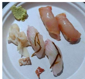
キンメダイの漬け握り (三宅島) ハマダイ混布メ握り (小笠原父島)