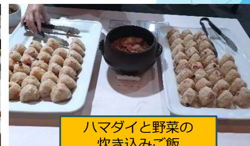
ハマダイと野菜の 炊き込みご飯