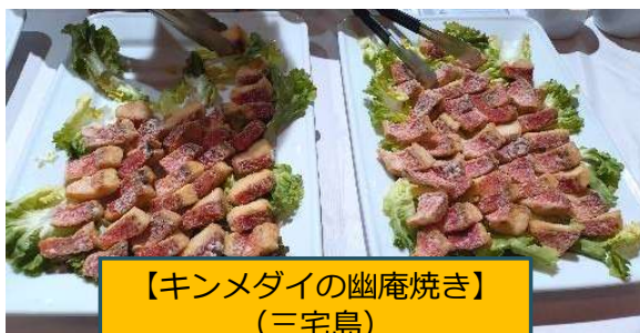
【キンメダイの幽庵焼き】 (三宅島)