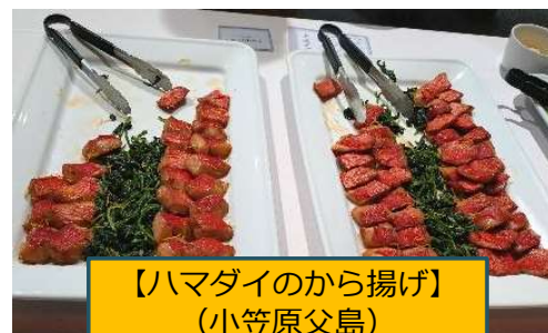
【ハマダイのから揚げ】 (小笠原父島)